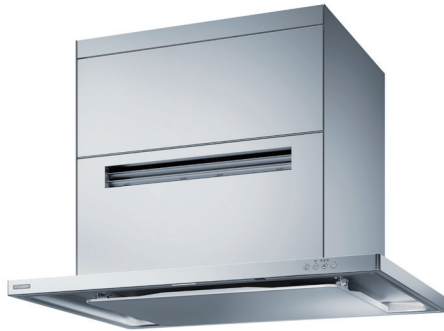
CMTR-RKS-902 SI + MTRS1-RFSS