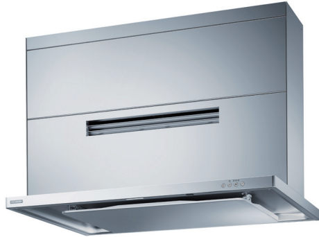
MTR-RKS-902 SI +MTRS1-RFSS