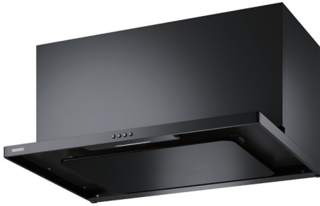
SASR-3A-902L BK (前幕板、横ふさぎ板、後幕板付属)

[色] BK ブラック W ホワイト SI シルバーメタリック SBK スモークブラック