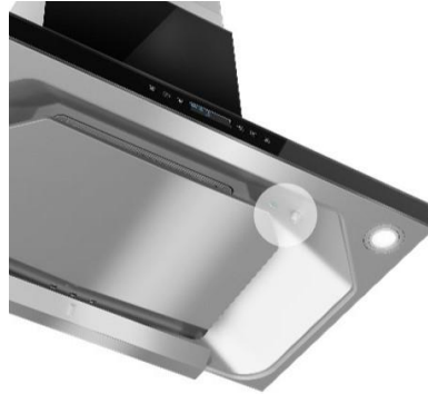
風量自動調節機能イメージ