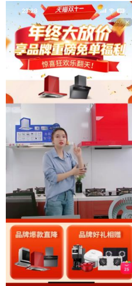
「天猫(英:Tmall)」でのライブ配信の様子 配信ではレンジフードのプレゼント抽選会も実施