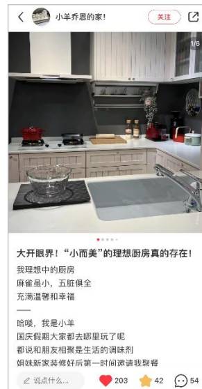
インフルエンサーによる 「小紅書(英:RED)」投稿

「ダブルイレブン」は、中国で11月に開催される毎年恒例の大型ECイベントで、多くの企業がECモールで様々なキャンペーンを実施しています。