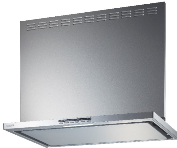
「SER-ECC-751/901」シリーズ イメージ

家庭用レンジフード製造・販売において国内シェア No.1 ※1 を誇る富士工業株式会社(神奈川県相模原市/厨房機器製造・販売/代表取締役社長 柏村浩介 以下、FUJIOH)は、CO 2 濃度を検知し自動換気する家庭用レンジフード「SER-ECC-751/901」シリーズを2020年12月14日(月)より販売開始いたします。