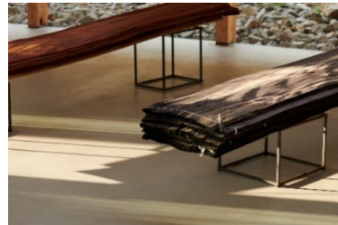
突板(安多化粧合板)